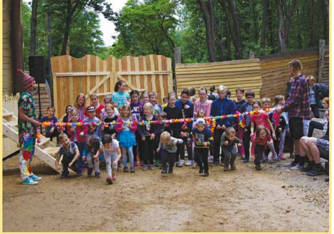
Děti v parku Krtkův svět