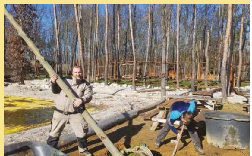
Josef pracuje - stavba Krtkova světa

Otevřeno denně e-mail: info@krtkuvsvet.cz www.KRTKUVSVET.CZ