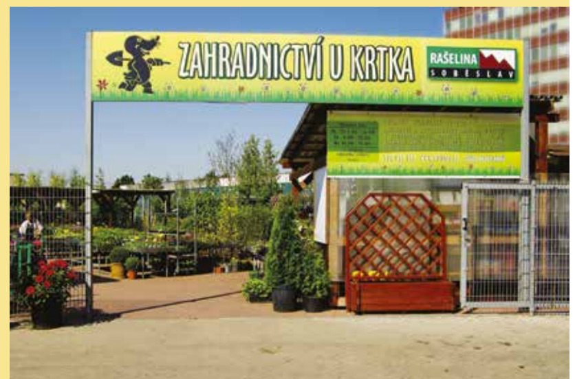
Zahradnictví u Krtka, Říčany

Krtkův skleník je unikátní projekt v ČR zaměřený na seznámení dětí s rostlinami a zvířaty. Celý prostor je tematicky ručně malovaný. Děti se naučí poznávat zvířátka a rostliny. Krtkův skleník doplňuje venkovní část, takže už můžete do Krtkova světa za každého počasí.