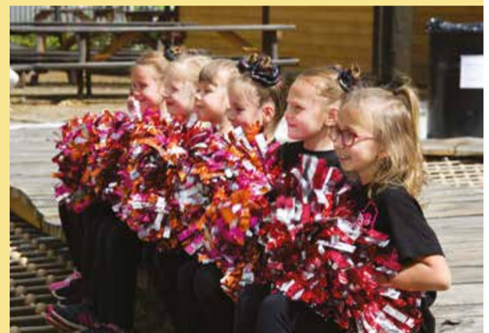
Mažoretky / Slavnostní otevření Krtkova světa